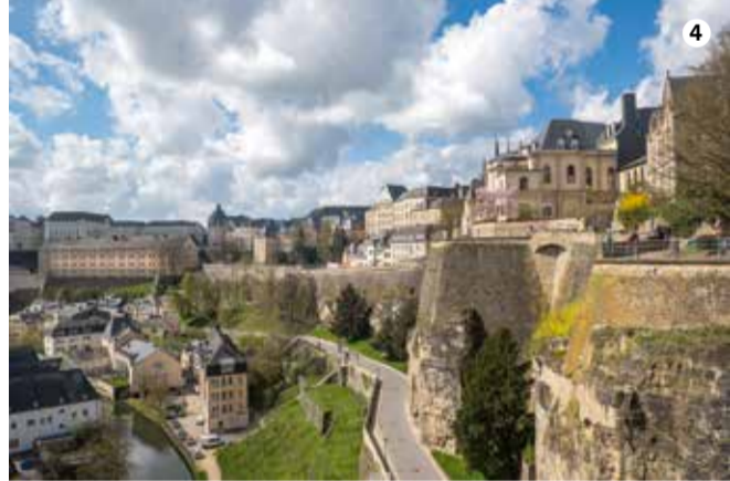
1 Citadelle de St Esprit 2 Parc de la Pétrusse 3 Parc de la ville Haute 4 Vue panoramique, Corniche

LE GOUVERNEMENT DU GRAND-DUCHÉ DE LUXEMBOURG Ministère de la Culture