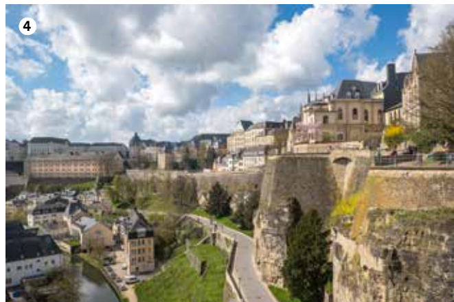
1 Zitadell um Hellege Gescht 2 Park an der Péitrus 3 Stater Park 4 Vue op d'Corniche

LE GOUVERNEMENT DU GRAND-DUCHÉ DE LUXEMBOURG Ministère de la Culture